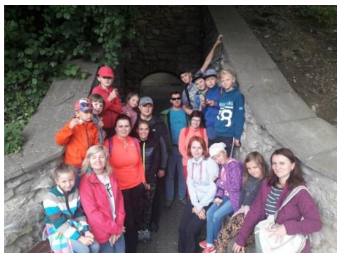
Zbrašovské aragonitové jeskyně