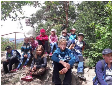
vyhlídka u Sv. Jana