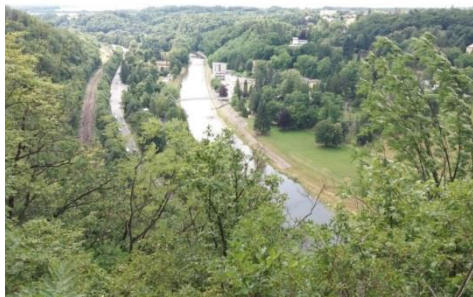
vyhlídka u bývalého hradu Svrčov