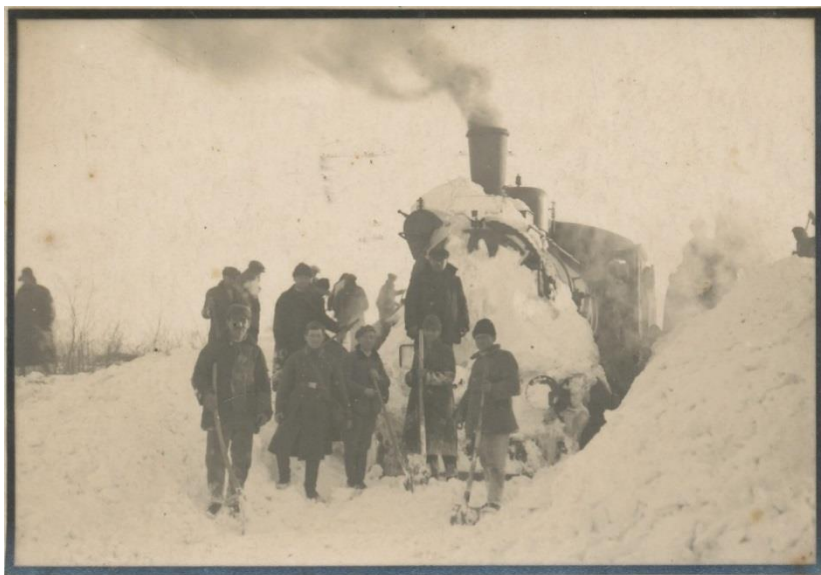
Záběr z odklízení sněhu