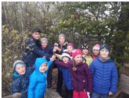
meč v kameni