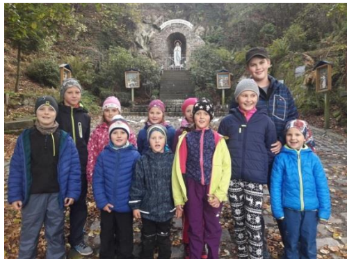
poutní jeskyně - Panna Marie Lurdská