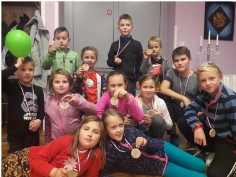
naši malí turisté si převzali pamětní plakety