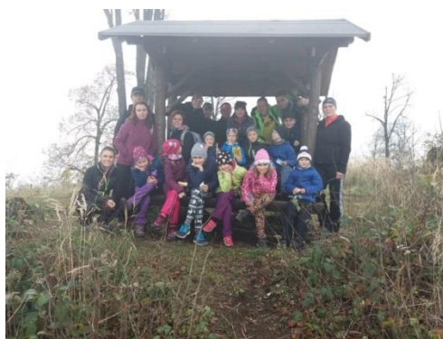
společně na vrcholu Petřkovická hora