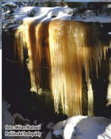
Pufčinské ledopády