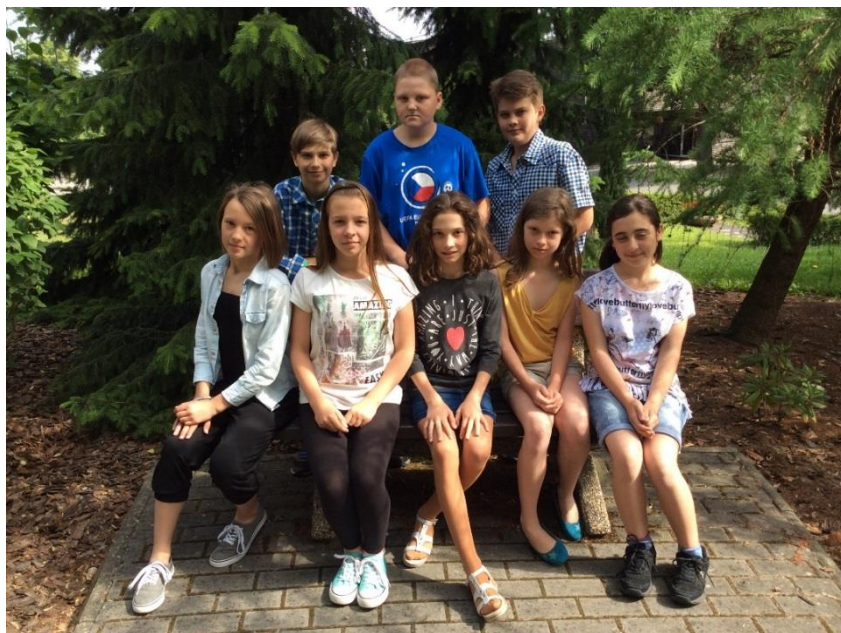
Naši odcházející pátáci