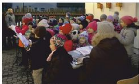
Děti ZŠ zpívají koledy