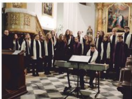
Pěvecký sbor Puellae et Pueri