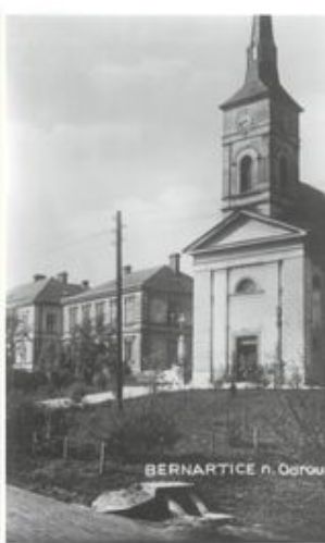
Kostel Navštívení Panny Marie z roku 1837