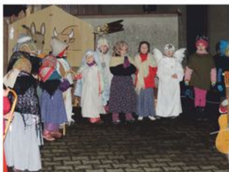
Děti MŠ představují betlém