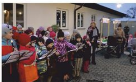
Vánoční jarmark na dvoře ZŠ