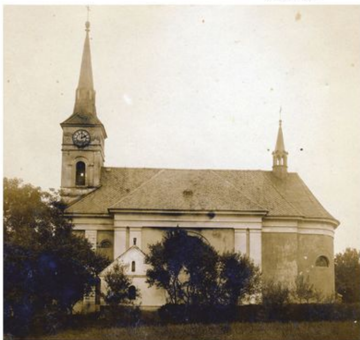
Pohled od obecního úřadu