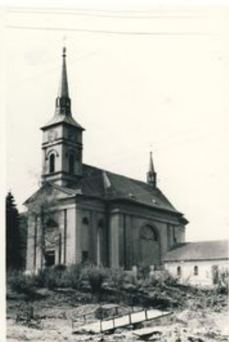
Kostel s původní márnici