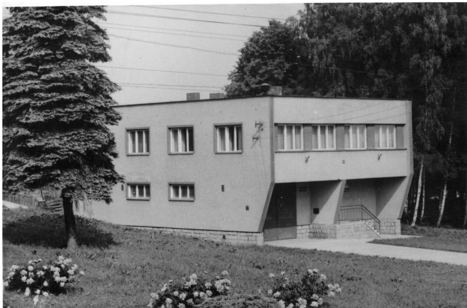
Budova obecního úřadu postavena v r. 1971