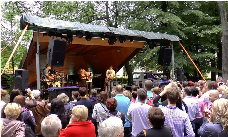
Vystoupení Věry Špinarové (Den obce Bernartice nad Odrou 27.6.2015)