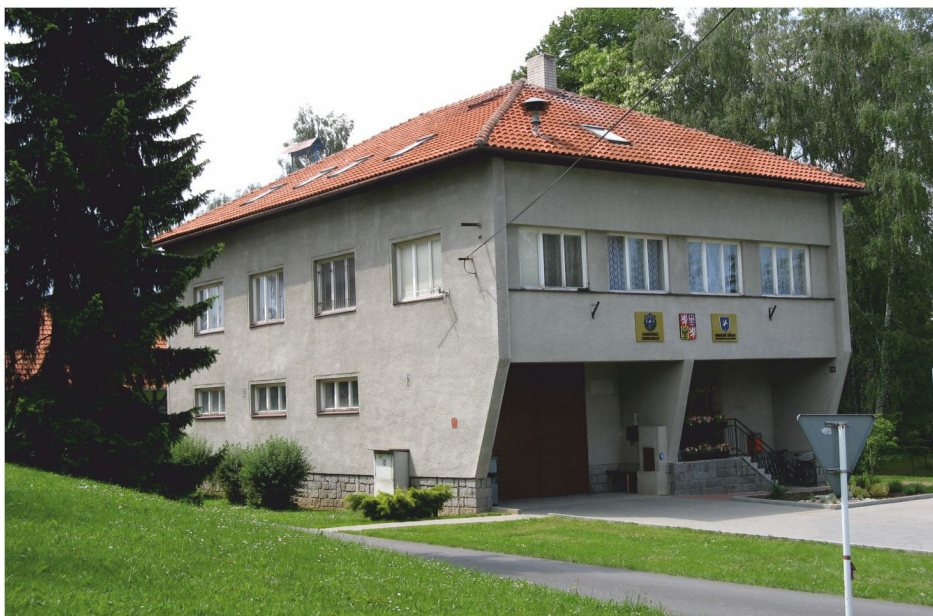
ÓÚ po přístavbě valbové střechy v r.1992