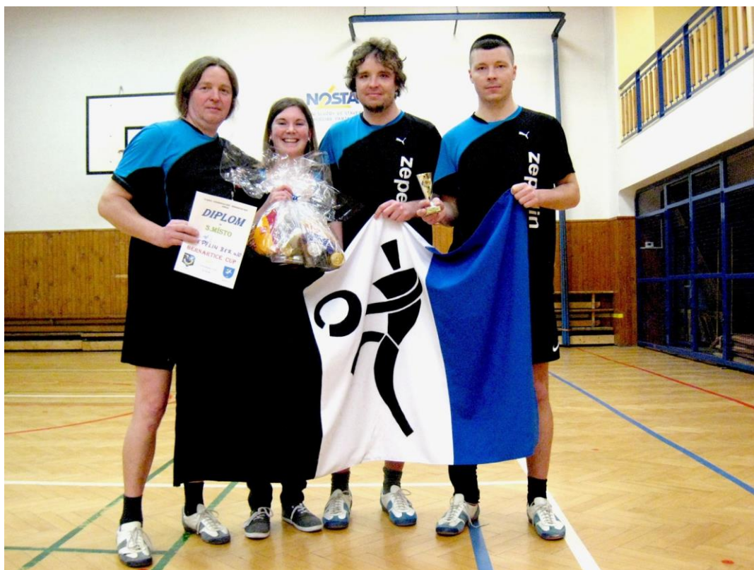
Zepelin Bernartice - 3.místo

Letošní ročník tak skončil nečekaným, ale o to příjemnějším úspěchem.