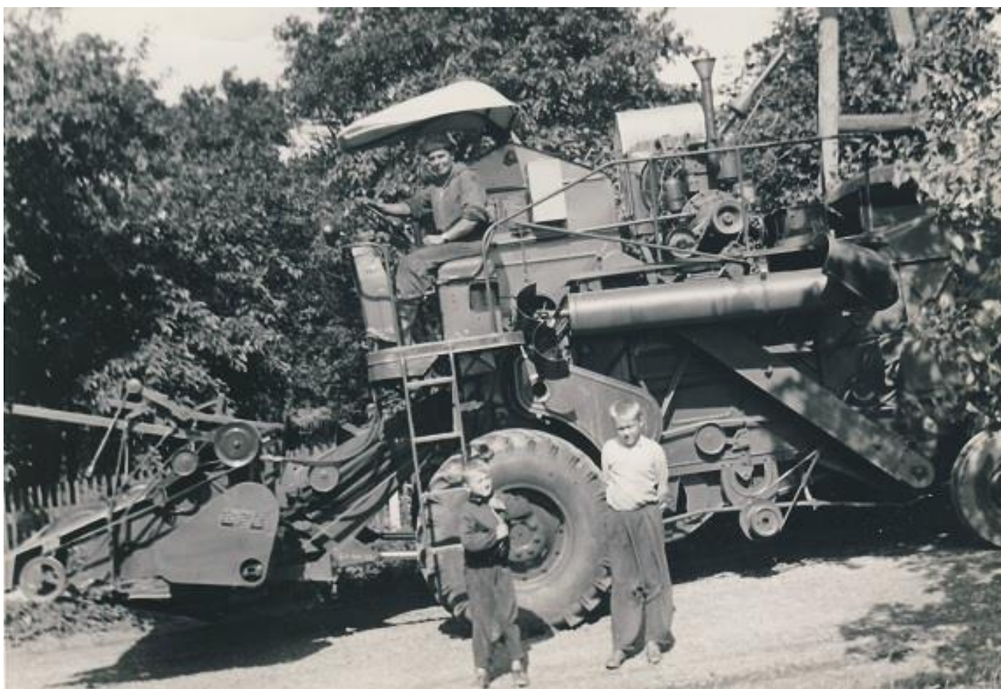
První kombajn JZD Bernartice nad Odrou – kombajnér Karel Staněk. Fotografováno v červenci 1963 u č.p. 115