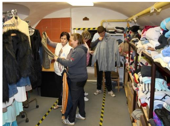
PROSTORY CHARITNÍHO ŠATNÍKU

V poslední době zaznamenáváme ke své velké spokojenosti narůstající zájem o naše služby a kladné ohlasy na tyto aktivity. Nutno však také podotknout, že veškerý vesměs symbolický příjem z těchto služeb je určen na pokrytí nutných nákladů spojených s jejich provozem.