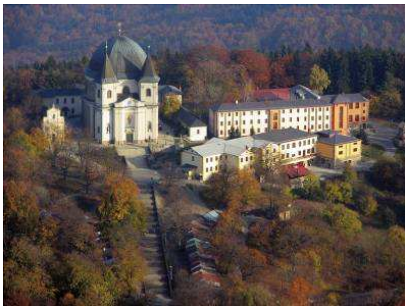
Areál svatého Hostýna