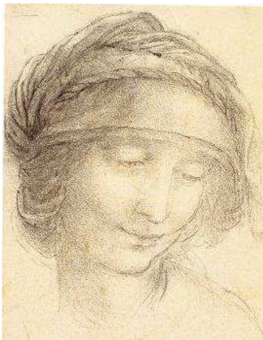
Hlava Sv. Anny - náčrtek Leonardo da Vinci