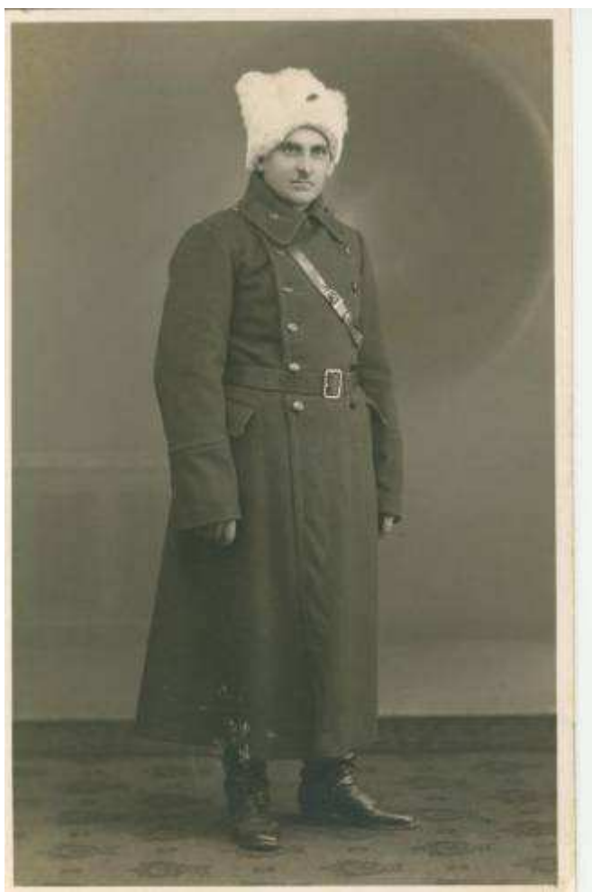
Ruská legionářská uniforma Ural – Jekatěrinburg Děda Eduš - leden 1918