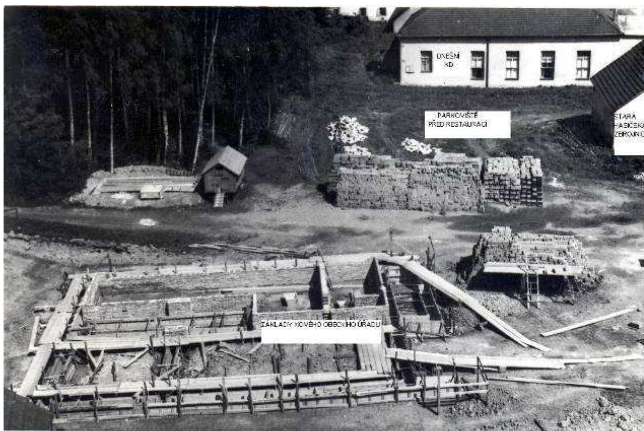
Základy nového obecního úřadu