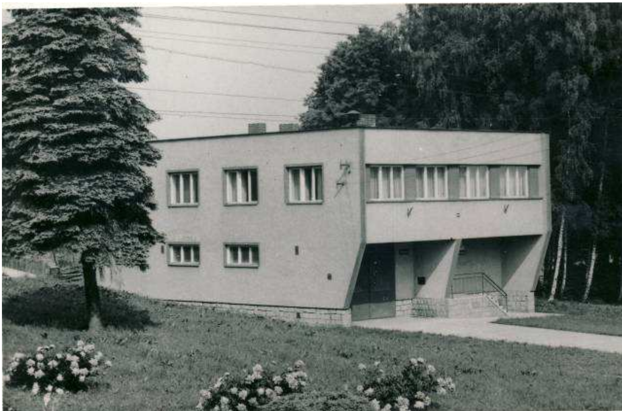
Rok výstavby 1971