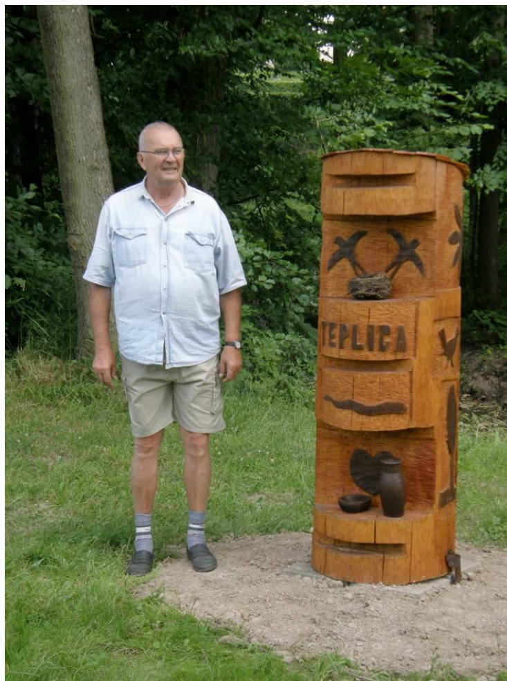
Ivan Prašivka, autor